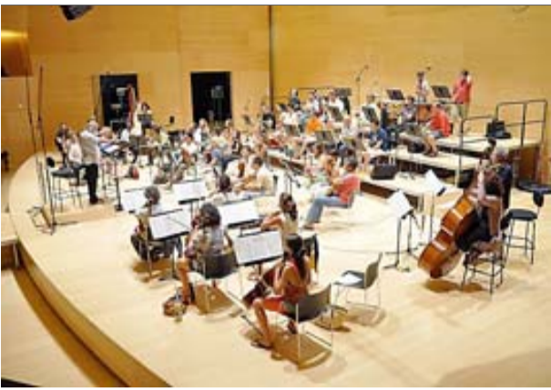
La Simfònica de Cobla i Corda durant la gravació del disc, a l'Auditori de Girona ■ SCC