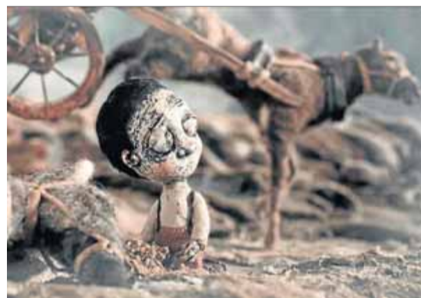
Un fotograma del film 'Cavalls morts' , que es projecta entre avui i demà a l'Aula Magna de la Casa de Cultura ■ voc

presentats) que aspiren als premis VOC. En la sessió d'avui es projectaran vuit curtsmetratges, un capítol de la websèrie El Ramon de les olives , el micrometratge Egeu i la pel·lícula El Rei Borni . Demà la sessió serà matinal, i s'hi podran veure els set curts restants, un capítol de la websèrie Les coses grans , el curt Voltes i voltes , i la pel·lícula El camí més llarg per tornar a casa (Premi Gaudí 2016). Durant cada sessió els assistents podran votar el millor curtsmetratge i contribuir a decidir el guanyador