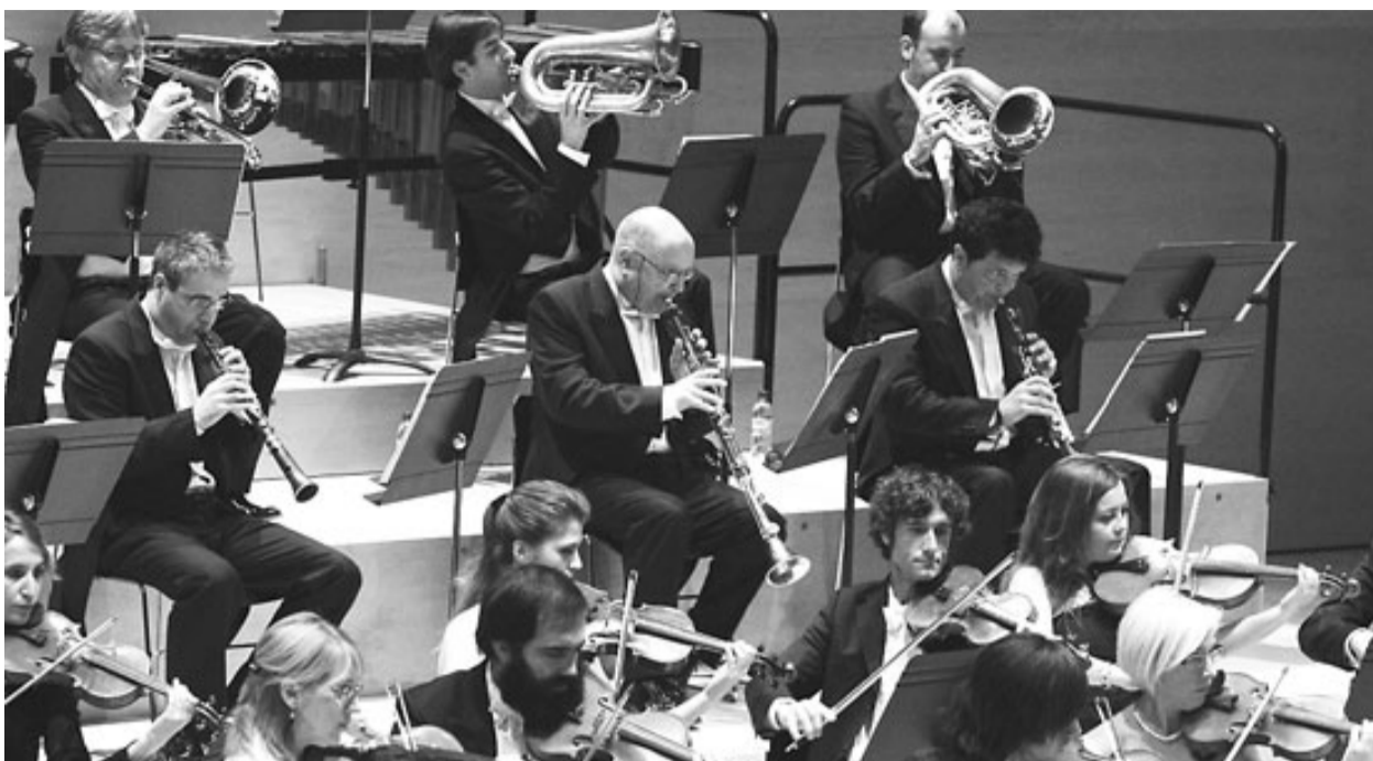
Un concert de la Simfònica de Cobla i Corda de Catalunya.