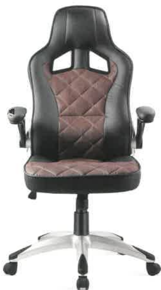
BLACK / BROWN