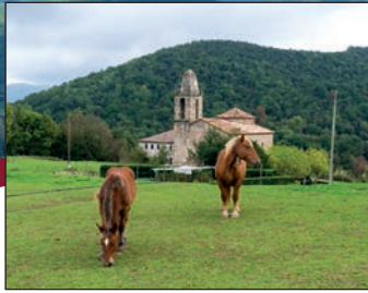
Sant Miquel Sacot