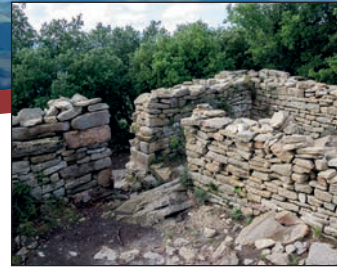
Ruinas castillo de Colltort