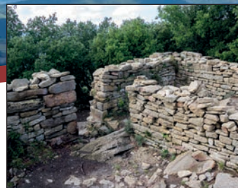
Vestiges château Collort