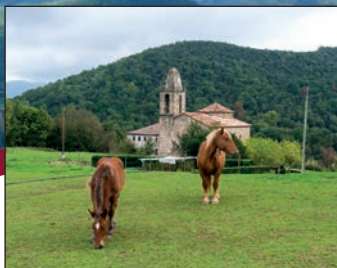
Sant Miquel Sacot