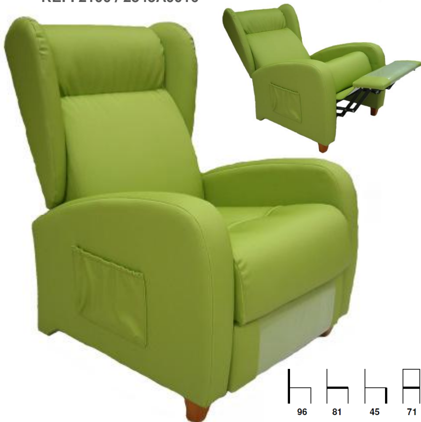
BUTACA RELAX ENARA REF. 2100 / 2345A0016