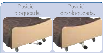
Posición bloqueada. Posición desbloqueada.

Freno independiente en cada rueda de la cama.