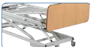
Elevador de piernas a cremallera.

EL ELEVADOR DE PIERNAS: se pueden elegir diferentes versiones de elevadores de piernas.