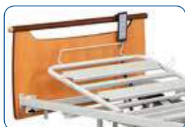
Elevador de respaldo eléctrico (estándar)

EL ELEVADOR DE RESPALDO: se pueden elegir diferentes versiones de elevadores de respaldo.