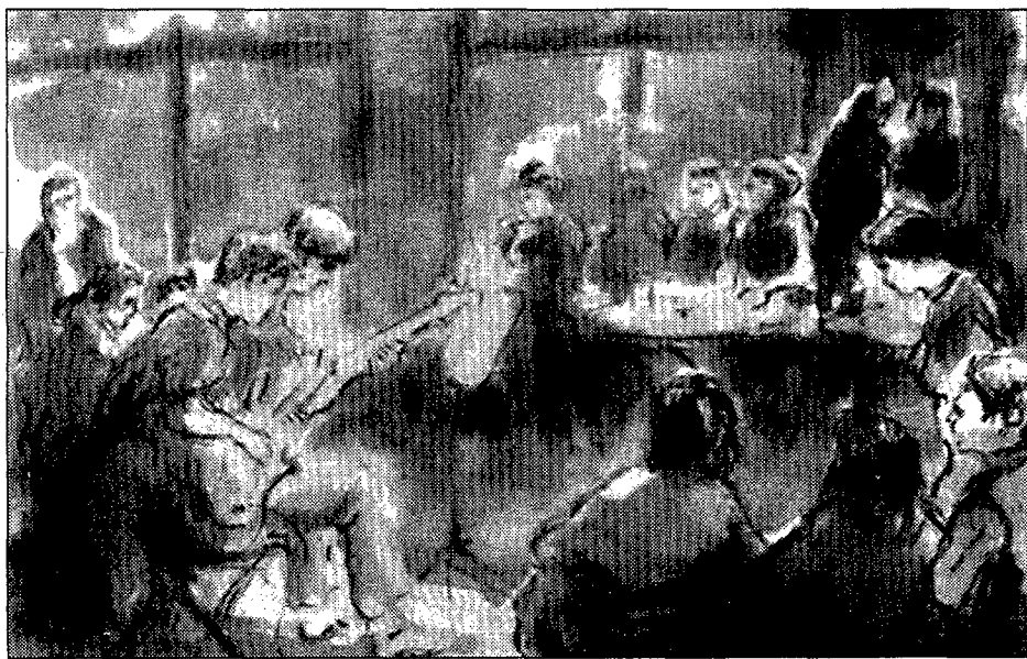
Jazz a Olot (1993), de Salvador Palou Vilà.