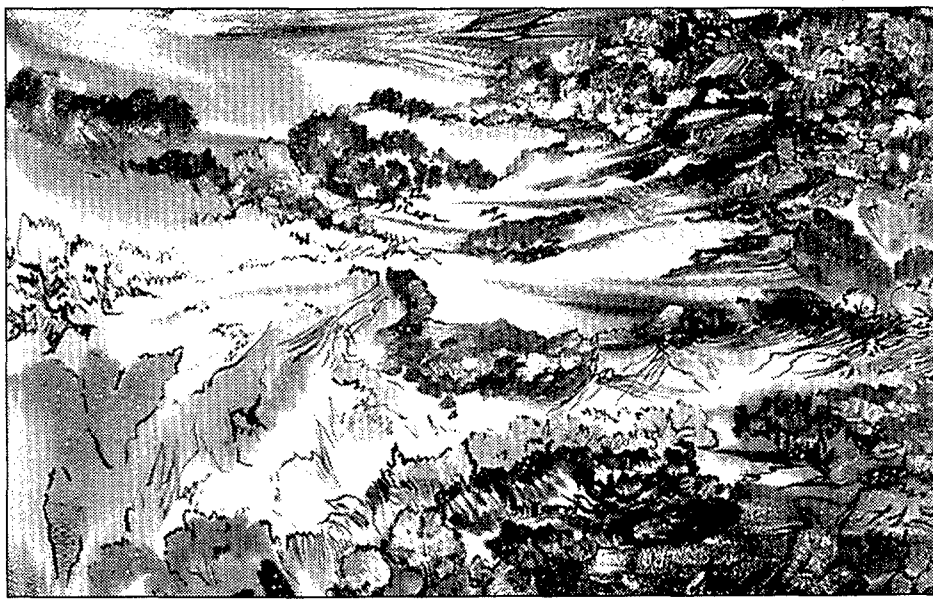
Les extenses àrees de color són constants en l'obra de Joan Domènech.

blaus i liles, les pintures de Palou Vilà reflecteixen escenes i ambients de la vida urbana de manera càlida i harmoniosa. Els seus personatges se succeeixen en una obra en què el dibuix capta la realitat fugaç i el color l'enriqueix. /T.C.