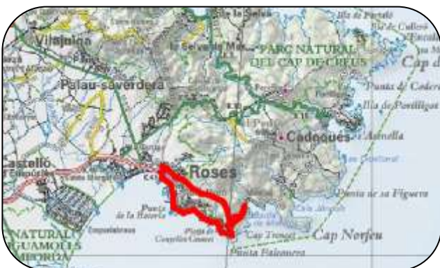
Mapa de la ruta