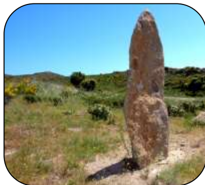
Menhir del Mas Marés