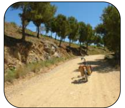
Camí cap a Cala Montjoi