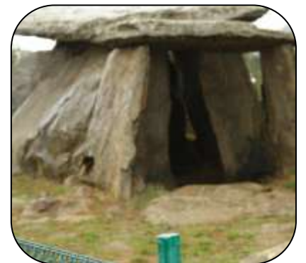
Dolmen de la Creu d'en Cobertella