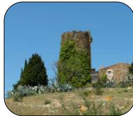
Torre del Mas del Sastre