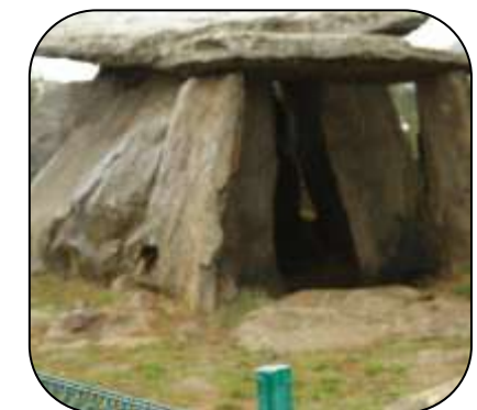
Menhir de la Creu d'en Cobertella