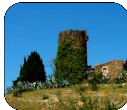
Torre del Mas del Sastre