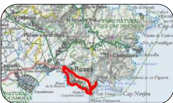
Carte de la route