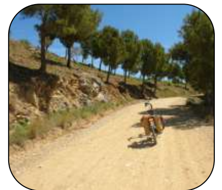
Chemin vers Cala Montjoi