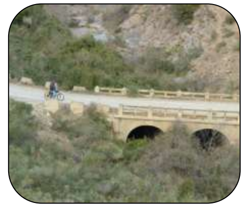
Pont a Cala Joncols