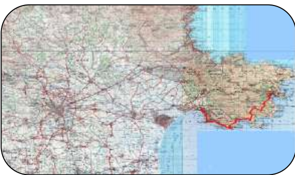
Mapa Alt Empordà