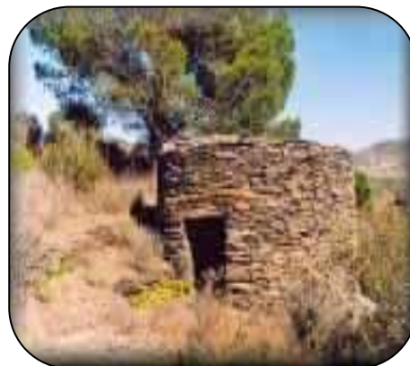
Cala Montjoi: El Bulli