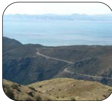
Cap Norfeu i badia de Roses