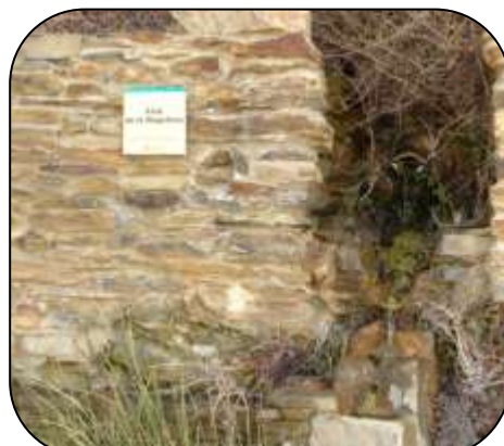
Platja de d'Empúries