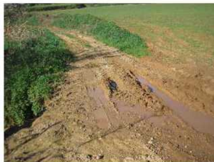
Camí del veïnat de Querol i Can Quer

Les actuacions consisteixen en el següent: