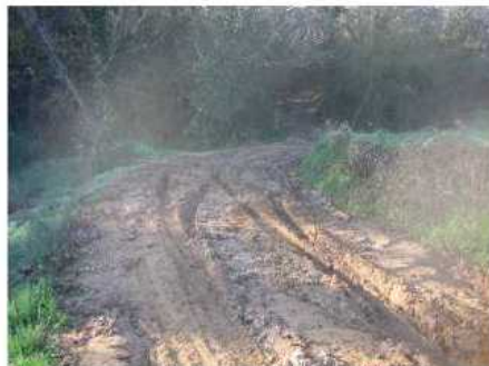
Camí de la Bruguera

Les imatges següents recullen l'estat actual d'alguns dels camins afectats: