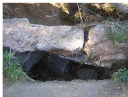
Imatges de l'estat actual del mur d'escullera

L'actuació que es proposa consisteix en retirar els blocs existents i construir un nou mur de blocs d'escullera, ben fonamentats i de major pes. La longitud del mur serà de 8 m aproximadament, amb una alçada mitjana de 3,50 m (incloent fonaments). Posteriorment es realitzarà la reposició del paviment asfàltic, amb una base de 20 cm de gruix de formigó HM-20 i una capa de rodadura de 5 cm de gruix d'aglomerat asfàltic en calent tipus AC16 SURF D amb reg previ d'adherència.