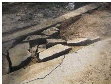
Imatges de l'estat actual del passallís

L'actuació proposada consisteix en l'enderroc del paviment i de la part malmesa de la plataforma de formigó, i l'execució d'un nou paviment de formigó armat. El paviment es realitzarà en un tram de 20 m de longitud. A la zona canalitzada aquest paviment es lligarà amb el formigó de la plataforma mitjançant connectors d'acer. A la resta el paviment s'estendrà sobre una base de graves de 20 cm de gruix. Finalment s'instal·larà la senyalització corresponent a gual inundable.