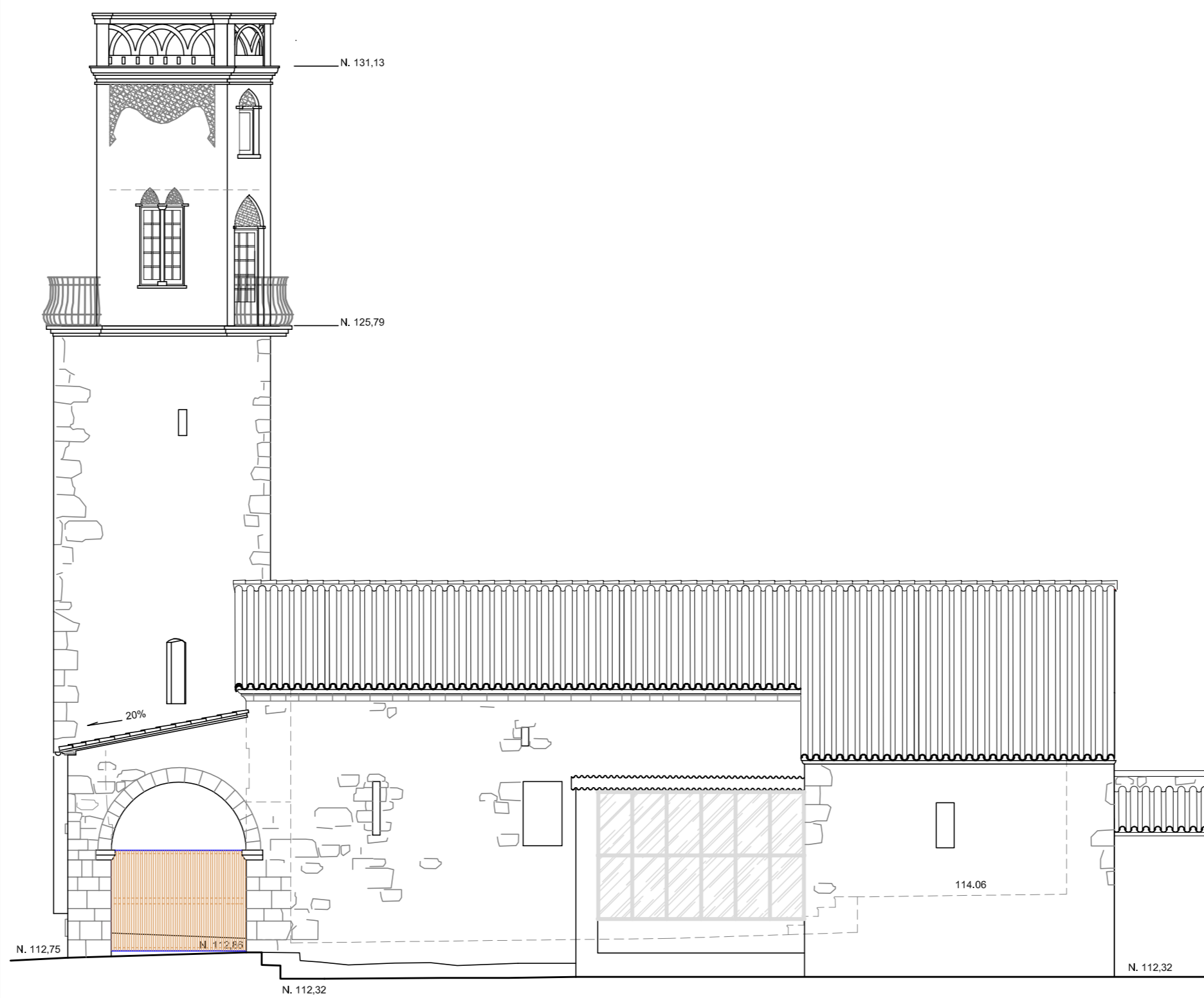
FAÇANA SUD (lateral)