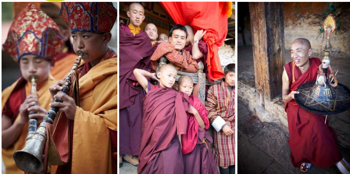
Festival Tamshing Phala Choepa a Bumthang