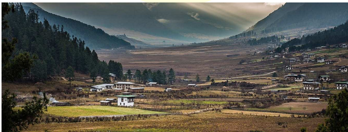
Vall de Phobjikha

A uns 30 minuts en cotxe de Punakha es troba Wangduephodrang, l'última població abans d'arribar al centre de Bhutan. El poble és cèlebre pel seu domini en l'art del bambú i també en el tallat de pedra. Des de Wangduephodrang, el camí travessa densos boscos de roures i rododendres fins arribar a Lawala, a on tot està cobert per petits bambús. Durant el recorregut tenim unes magnífiques vistes panoràmiques cap a les muntanyes de l'Himàlaia. Després fem un llarg descens, que sorprèn per la meravellosa vista del Gangtey Goenpa i la vall de Phobjikha. Visita del Gangtey Goenpa, l'únic monestir de Nyingmapa a l'oest de Bhutan. Després, a la tarda, tindrem temps per interactuar amb els monjos que estudien a Kuenzang Choling Shedra. El monestir ofereix cursos de nou anys en estudis budistes. Nit en hotel de la vall.