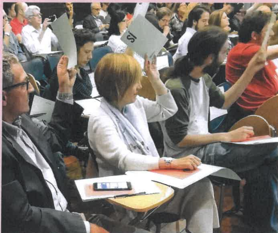
Votacions durant la constitució de la XMESS, maig de 2017.

En el comentari següent, intentaré esbossar una classificació de les polítiques públiques d'ESS, integrant les de les tres generacions i afegint algunes altres, al meu parer també necessàries, que encara no s'han desplegat a casa nostra.