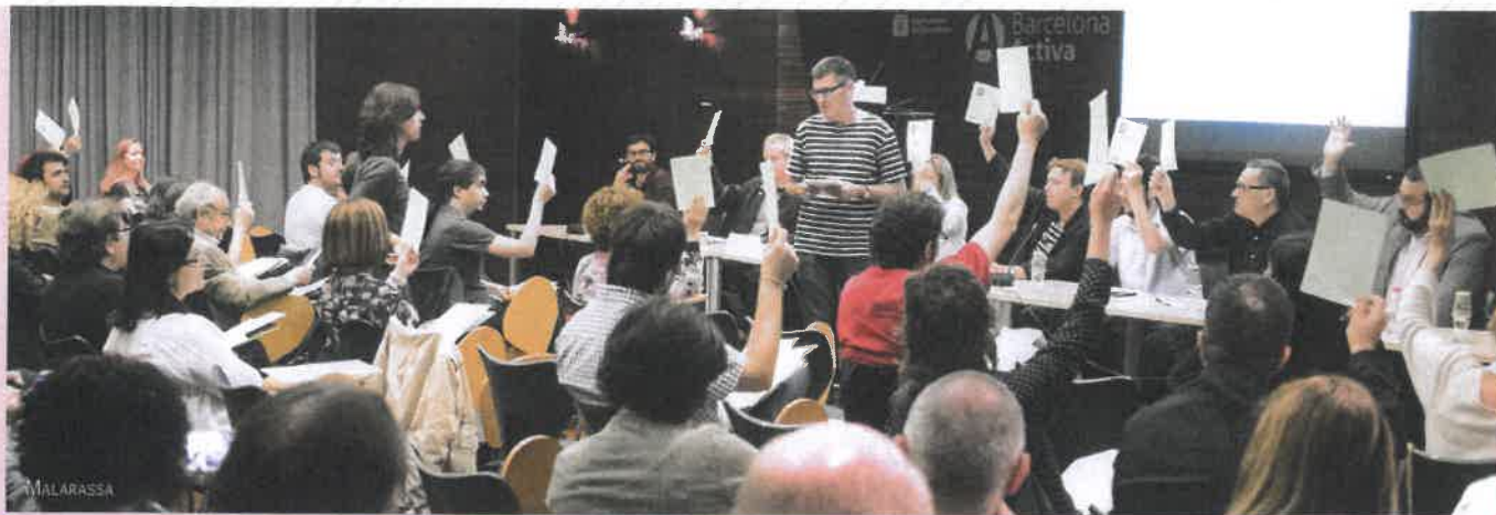
Assemblea de constitució de la Xarxa de Municipis per a l'Economia Social i Solidària (XMESS).

de las actuales políticas de fomento de cooperativas y sociedades laborales frente a la crisis en España (REVESCO, Facultad de Ciencias Económicas y Empresariales, Madrid) 2 .