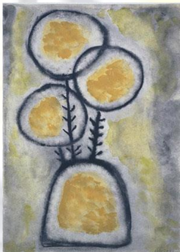
"Trois fleurs jeunes" © Mercè Rodoreda, VEGAP, Barcelona, 2018.

4 i 5 d'abril de 2019 Institut d'Estudis Catalans, Barcelona