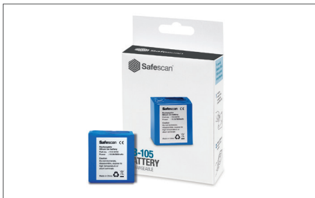
Safescan LB-105 La batería de litio recargable Art. no: 112-0410