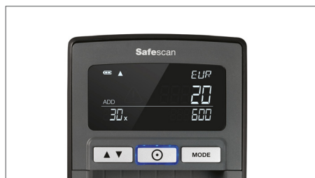
Muestra cantidad y totales