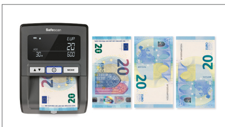
Introduzca billetes de euros en cualquiera posición