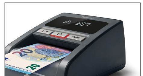
Alarma de billete sospechoso con alerta visual y auditiva