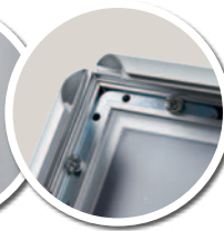
Apertura / cierre mediante perfil abatible