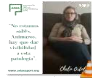
4 TESTIMONIO CHFI O