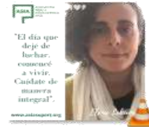
3 TESTIMONIO FI FNA