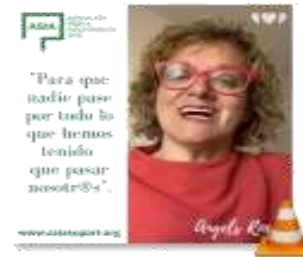
2 TESTIMONIO ANGFI S