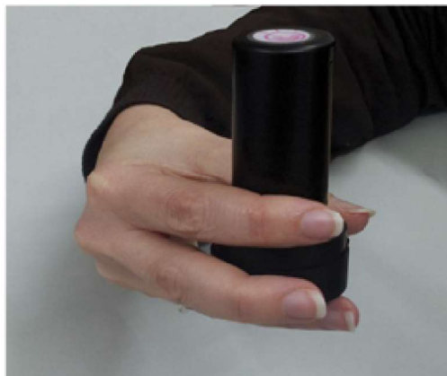
1) Treieu el mànec estirant-lo i fent un petit moviment de rosca