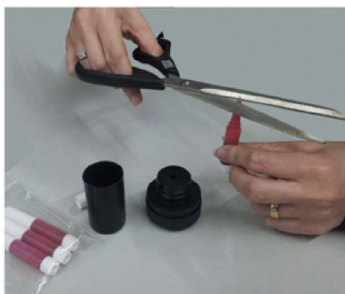
2) Talleu la pipeta de l'ampolleta botellín de tinta a la mida justa perquè encaixi amb el forat.