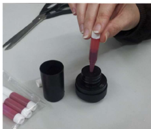
3) Aboqueu tota la tinta. Cada ampolleta conté la mida justa per a cada reentintada. No n'aboqueu més d'una. No reentinteu si no és necessari.