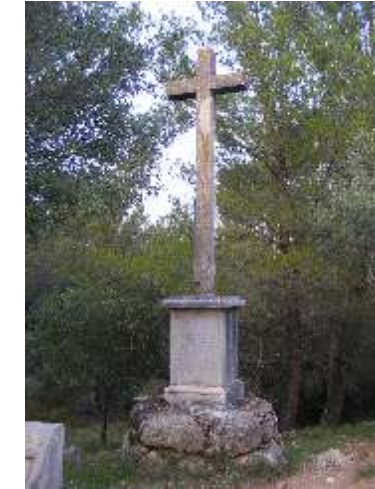
4. La Creu. Com explica la inscripció a la base, commemora la mort del "Generalísimo" de les tropes espanyoles, Luis Carvajal, en la cruenta batalla del Roure, dins de la guerra Gran o guerres de la Convenció (1794).