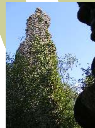
7. Ruïnes del castell de Molins. També anomenat torre d'en Buach, formava part dels dotze castells defensius de la vila de Llers, quan conformava el límit del comtat de Besalú.

asfaltats o encimentats. La primera part del recorregut passa entre olivars, ben farcits de petits ocells a l'època de les olives i on es pot veure alguna perdiu. La segona part transcorre entre garrigues i pinedes de pi blanc, on viuen abellerols, mallerengues i tallarols. Val la pena mirar al cel a la recerca de rapinyaires, com el xoriguer, l'aligot o l'àguila marcenca. Finalment, la tercera part segueix el curs de la Muga, on el bosc de ribera dóna refugi a oriols i martinets de nit, i el riu és el lloc de pesca de blauets i llúdrigues. Encara que sigui molt difícil veure una llúdriga, podem trobar els seus excrements al cim dels còdols.