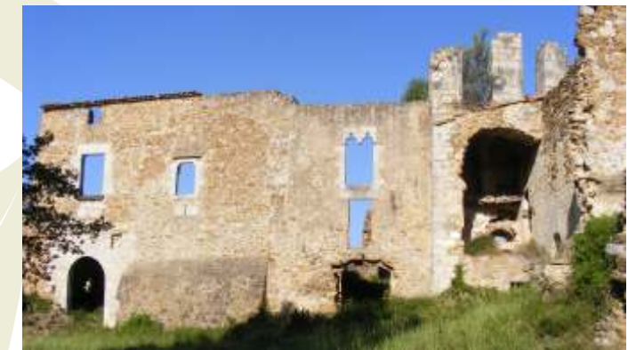
5. Monestir de Santa Maria del Roure. L'origen del conjunt de Santa Maria del Roure és una església romànica de la primera meitat del segle XII, relacionada amb el castell de Montmarí, amb una funció de torre de guaita avançada. A finals del segle XII s'instal·la l'ordre de Sant Agustí i, molt probablement, l'abat de Vilabertran (Lluís Berenguer, nascut a Llers i futur bisbe de Girona) funda el monestir. A començaments del segle XIV, el monestir es troba en un estat ruïnós pels assaltaments del comte d'Armanyol. El 1408 el Papa Benet XIII impulsa la reconstrucció del conjunt, que es fa seguint els canons de l'estil gòtic. El 1485 els Agustins són expulsats a causa de les guerres dels Remences. A principis del segle XVII es construeix l'església Nova i la Verge del Roure es converteix en la patrona de l'Empordà. A la segona meitat del segle XVII mor l'últim sacerdot que habitava al monestir. Durant les guerres contra els francesos (la guerra Gran, 1794), el monestir va servir de caserna a l'exèrcit espanyol i a causa de l'intercanvi de trets de canó amb els francesos, que ocupaven el castell de Mont-roig, el monestir va quedar destruït. El 1818 hi va haver un intent de reconstruir l'església Nova però va fracassar i el conjunt va quedar abandonat. Als anys vuitanta del segle XX es van fer treballs de consolidació a la façana principal i als arcs de l'església gòtica. Actualment, el monestir i el terreny del vessant oriental són propietat de l'Ajuntament de Pont de Molins.