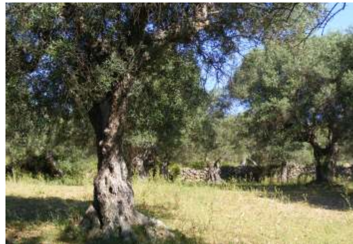
2. Olivars de la serra d'en Jordà. Es troben al llarg del camí que puja al santuari de la Mare de Déu del Roure. Són majoritàriament de la varietat picual, amb algunes de varietat culivell. Moltes tenen troncs centenaris, la majoria supervivents de "l'any de la fred" (1956).