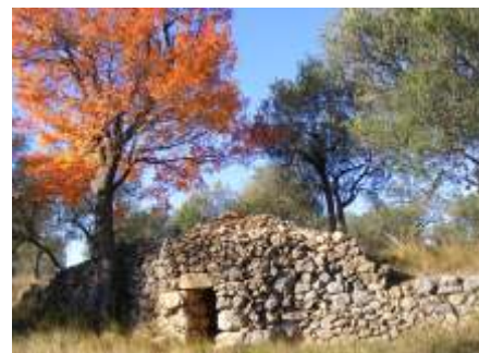
3. Barraques de pedra seca. Aquestes construccions són el patrimoni mut d'una època laboriosa, refugi de camperols, jornalers del camp i passavolants de tota mena. En aquesta zona són molt abundants, gairebé cada finca gran té la seva barraca.

Aquest itinerari és part del projecte de recuperació agro-forestal i social de la Muntanya del Roure, finançat per l'Obra Social de la Caixa i la Diputació de Girona. Aquest projecte ha permès la recuperació de murs de pedra seca, la millora forestal dels voltants del monestir del Roure, la creació d'una bassa per la fauna i l'obertura d'un camí abandonat, que ha possibilitat l'itinerari circular que us presentem. L'itinerari té una longitud de 6,7 km i un desnivell d'uns 100 metres, i es pot recórrer en unes tres hores. El grau de dificultat és baix, amb alguns trams