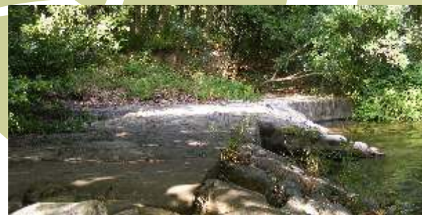
6. Pont del Molí d'en Jordà. Aquest pont va ser el pas per creuar la Muga en el camí de Pont de Molins a Les Escaules, abans que existís l'actual carretera comarcal. Construït a l'Alta Edat Mitjana, ha sofert nombroses modificacions a causa dels desperfectes de "les mugades" (avingudes de la Muga) fins a arribar als nostres dies.

asfaltats o encimentats. La primera part del recorregut passa entre olivars, ben farcits de petits ocells a l'època de les olives i on es pot veure alguna perdiu. La segona part transcorre entre garrigues i pinedes de pi blanc, on viuen abellerols, mallerengues i tallarols. Val la pena mirar al cel a la recerca de rapinyaires, com el xoriguer, l'aligot o l'àguila marcenca. Finalment, la tercera part segueix el curs de la Muga, on el bosc de ribera dóna refugi a oriols i martinets de nit, i el riu és el lloc de pesca de blauets i llúdrigues. Encara que sigui molt difícil veure una llúdriga, podem trobar els seus excrements al cim dels còdols.