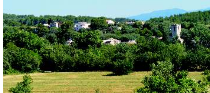
1. Barri de Molins. Nucli primitiu del poble de Pont de Molins. Amb documentació de nucli habitat des de segle XII (el Mas Joer). Durant varis segles va ser el coract u laboral, polític i econòmic de la població.